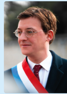
Sacha Houlié candidat Avocat, député, président de la commission des Lois

Je n'oublie pas ceux qui manquent de tout et les banques alimentaires et associations d'aide aux démunis , qui reçoivent pour les aider près de 500.000 euros grâce à notre soutien.